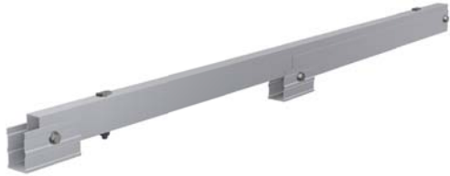
Triángulo plegado premontado